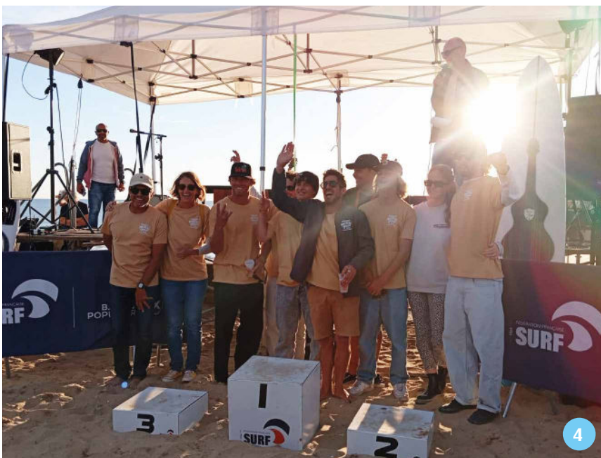
1 Marche Octobre Rose 2 Feu d'artifice du 14 juillet 3 Inauguration Office de Tourisme et Gendarmerie 4 Championnat de France Master Longboard